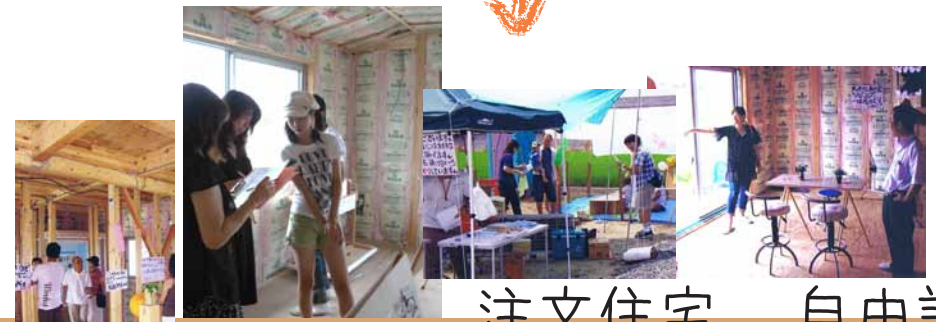
注文住宅、自由設計